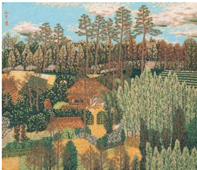
1940-56年 紙 45.9×53.3cm 世田谷美術館蔵