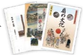
あるむ刊行物より

ARM corporation 株式会社あるむ 〒460-0012 名古屋市中区千代田三丁目1-12 第三記念橋ビル3F TEL.052-332-0861 FAX.052-332-0862 E-mail:arm@a.email.ne.jp http://www.arm-p.co.jp