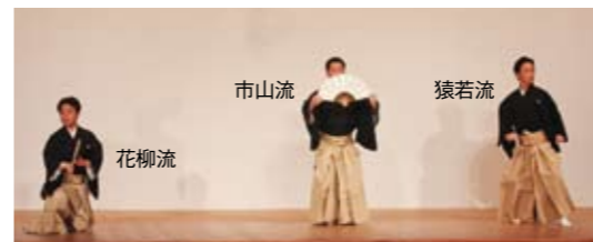
扇子の扱い方も、各流派でまったく異なる。その違いを体験できる貴重な機会。