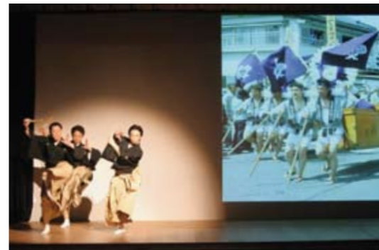
実際の「御柱祭」の写真を見ながら、演目解説。この祭りの一場面一場面が舞踊「御柱祭」に反映されている。