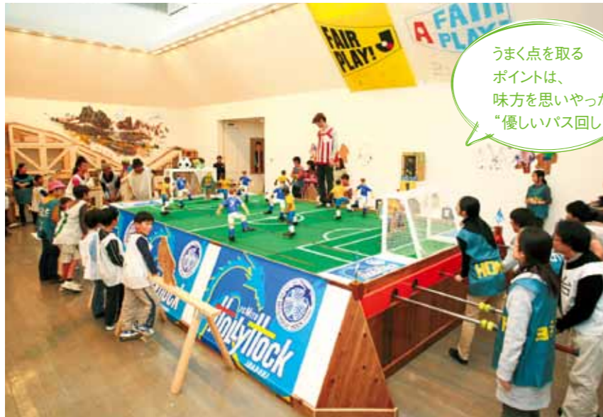
2008年 水戸芸術館現代美術センターでの展示の様子