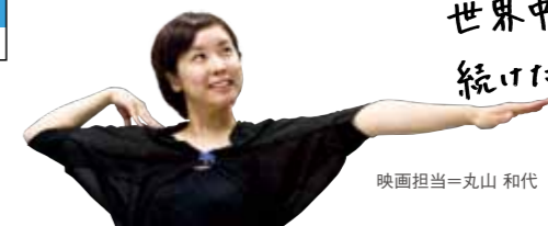
映画担当=丸山 和代