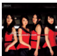
【スリラー ~マイケル・ジャクソン・クラシックス】 ¥2,940(税込) 2012年 日本コロムビア