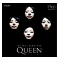
【ウィ・ウィル・ロック・ユー ~クイーン・クラシックス】 ¥2,940(税込) 2011年 日本コロムビア