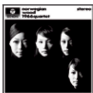
【ノルウェーの森 ~ザ・ビートルズ・クラシックス】 ¥3,000(税込) 2010年 日本コロムビア