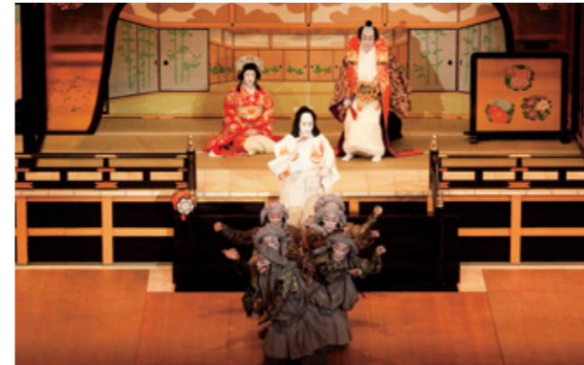
松竹大歌舞伎 7/15(月・祝) @春日井市民会館

Report 30~33はHPで紹介します www.kasugai-bunka.jp/diary