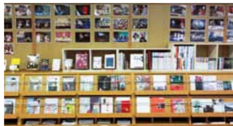
皆さまに読んでいただけるよう、雑誌のバックナンバーも揃えています