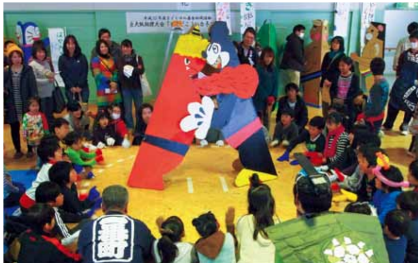
2012年 仙台市青葉区中央市民センターでのイベントの様子

『AC-サボテン』は、誰でも気軽に参加できるよう、“遊び”を取り入れた巨大サッカーボードゲーム。一人や二人では遊べないくらい大きいんです(笑)。なので、会場に居合わせた者同士がチームメートになって、試合に挑まなくてはなりません。交わることのない人たちが、関わるきっかけとなる作品です。11/27~12/25の水曜日には、チームで参加できる『公式戦 サボテンカップ』を開催。12/25(水)には決勝トーナメントも行います!