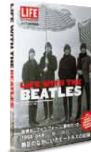
廣田出版 二〇一三年・十月発行

世界中のファンに支持されながら、わずか十年足らずで事実上の解散を迎えた伝説のロックバンド「ザ・ビートルズ」。本書は、彼らの舞台裏を追い続けた一人の公式カメラマン、ロバート・ウィテカーが、彼らの素顔を実直に捉えた写真集です。トップアーティストのリラックスし