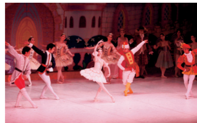
東京バレエ団 子どものためのバレエ なむれる森の美女 8/15(木) @春日井市民会館