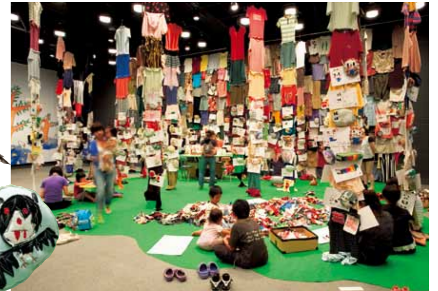
2010年 広島県現代美術館での展示の様子

ギャラリーで毎日制作しているの、どんな人が来るか楽しみです。日々変わる作品を見に、何度でも通ってください。お待ちしております!