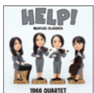
【ヘルプ!】 ~ビートルズ・クラシックス】 ¥2,940(税込) 2013年 日本コロムビア