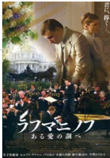
天才作曲家 セルゲイ・ラフマニノフの生涯を軸に展開されるストーリー、情熱的な演技