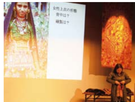
インド・東南アジア編