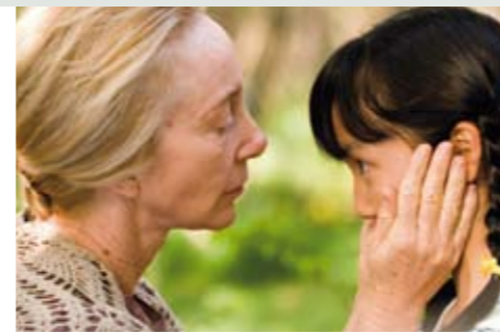
渡部氏が撮影監督を務めた映画「西の魔女が死んだ」アズミックよりDVD発売中