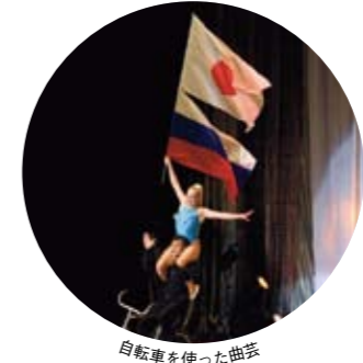
自転車を使った曲芸