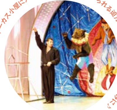
ユーモラスなクマの曲芸