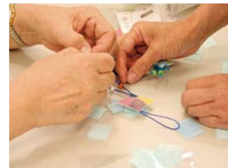
携帯ストラップをつくろう!