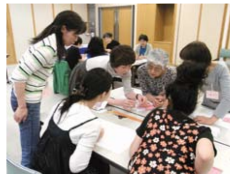
ポジャギ作り講座

身近な人のために心をこめて作ること、風土と知恵のなかで育てられた手しごとの美しさなど、一人ひとりの心に余韻を残した講座となりました。