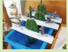
カラカラの砂漠で生きているイメージが強いサボテンですが、実は水だけでも育つのだそうです。