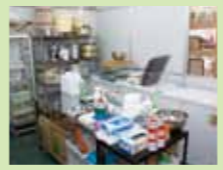
店奥のラボでは、サボテンの研究や加工を行います。保管用の冷凍庫もいっぱい!