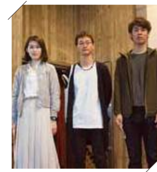
大阪市より ● オオサカ・シオン・ウインド・オーケストラのみなさん

劇場建築を学ぶ学生さんが、市民会館を見学に来られました。「今はシャープさが流行りですが、階段の手すりのぶ厚さや柱の重厚さは、当時のモダンなデザインを取り入れた感があります。コンクリート打ちっばなしの壁は、50年で面白い味が出ているですね。勉強になりました」