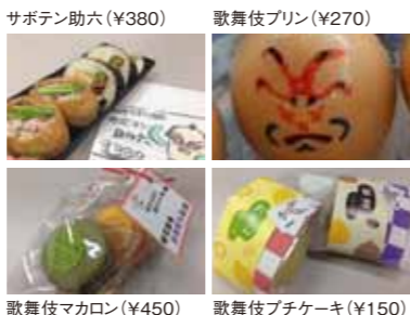
サボテン助六(¥380) 歌舞伎プリン(¥270) 歌舞伎マカロン(¥450) 歌舞伎プチケーキ(¥150)

歌舞伎鑑賞で忘れちゃいけないお土産コーナー。限定商品は要チェックです。会場ロビーでは、『こだわり商店』が春日井限定の栗餅やサボテンを使ったオリジナル歌舞伎フードを販売します。また毎年恒例のお土産コーナー「縁起いい屋」も、充実の品揃えで登場。人気アイテムは売切必至です。お楽しみに！