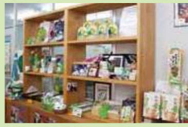
食べ物を中心に、サボテン好きにはたまらない豊富なラインナップ。『のどに刺さらないサボテンのど飴』が一押し!