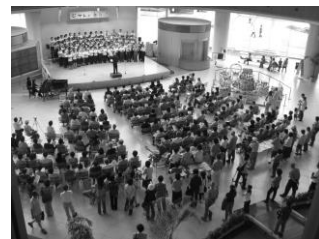
本番会場「交流アトリウム」