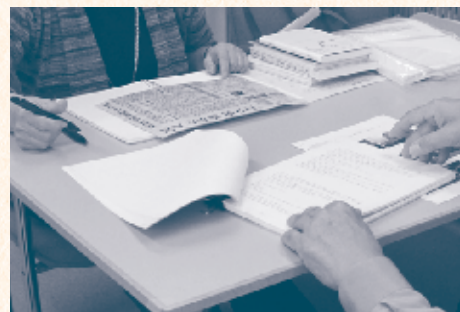
日本自分史センター (文化フォーラム春日井・2階) 利用時間 9:00～19:00