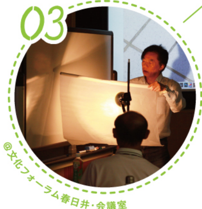
@文化フォーラム春日井・会議室