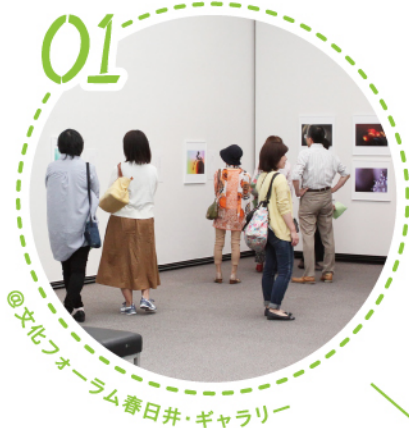
@文化フォーラム春日井・ギャラリー