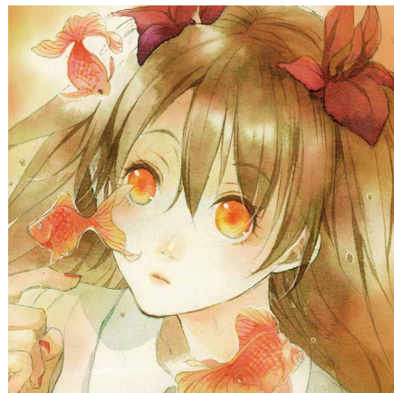
金魚と少女 | 2019 カラーインク使用作品

1983年生まれ、愛知県江南市出身。2007年名古屋造形芸術大学大学院造形研究科修了。在学中からライトノベルの挿絵を担当するなど、イラストレーター、絵画師として活躍。現在、名古屋造形大学マンガコースコミックイラストレーションゼミ特任助教。主な作品に、集英社コバルト文庫榎木洋子著「乙女は龍を導く」シリーズ全7巻イラストおよび挿絵(2006-2008)、第2回・第3回青空文庫有名小説表紙絵コンテスト優秀賞(2014)などがある。