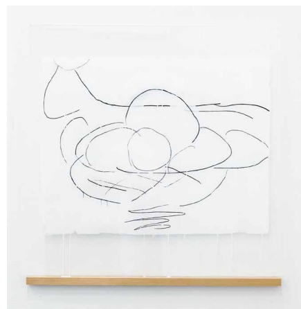
画用紙(果物かご) | 2017