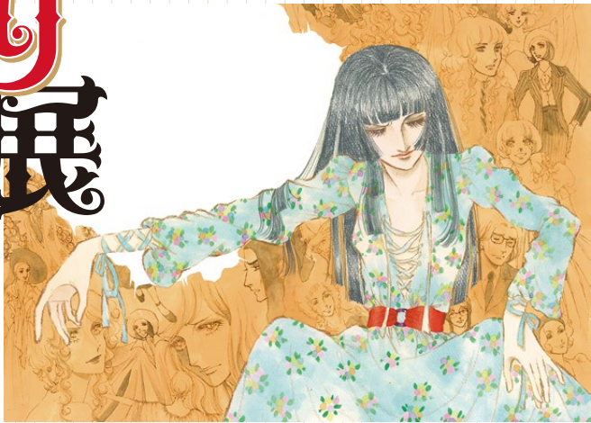
デザイナー「りぼん」1974年12月号 扉