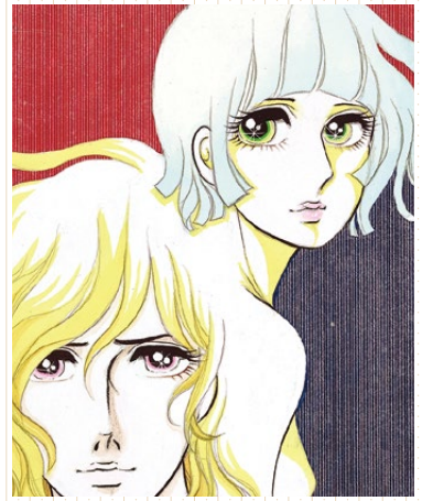
風の中のクレオ(前編)単行本カバー 1971年1月

ド ラマチックなストーリーと華やかな画風で人気を獲得し続ける少女漫画のクイン・一条ゆかり。1968年『りぼん』3月号でデビューし、不良性と強い野心を持った異色の主人公像は、少女漫画の定説を打ち破りました。読者から絶大な人気を誇った代表作「デザイナー」「砂の城」に加え、恋愛漫画家のイメージを一転させたアクションコメディ「有閑倶楽部」は世代も性別も超えた大ヒットとなり、第10回講談社漫画賞を受賞。2003年より2人の女性がオペラを通じて成長する姿を描いた「プライド」の連載を開始した一条は、その間、緑内障と闘いながら迫力のあるストーリーを作り上げ、第11回文化庁メディア芸術祭マンガ部門優秀賞を受賞しました。恋愛エッセーなども数多く出版し、ライフスタイルも注目されています。本展では貴重な初期作品から代表作「デザイナー」「砂の城」「有閑倶楽部」「正しい恋愛のススメ」「プライド」などの原画を中心に、人生の全てを漫画に捧げ、トップを走り続けた一条の約50年にわたる画業をご紹介致します。