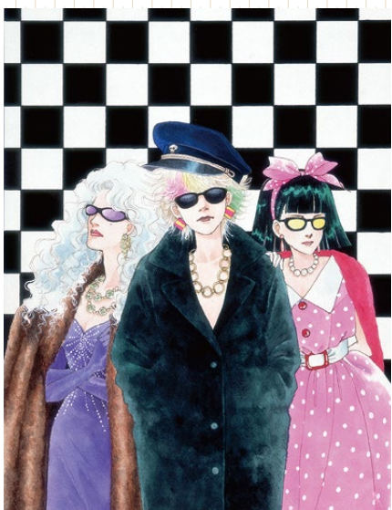
有閑倶楽部「りぼん」1984年2月号 扉