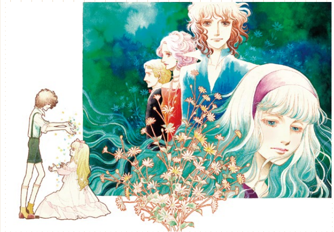
砂の城「りぼん」1977年7月号 扉(部分)