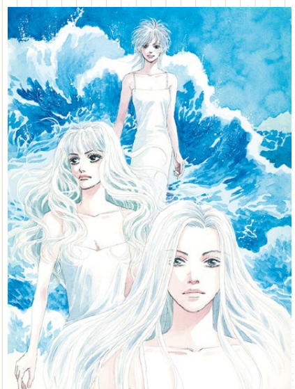
プライド「コーラス」2006年9月号 扉