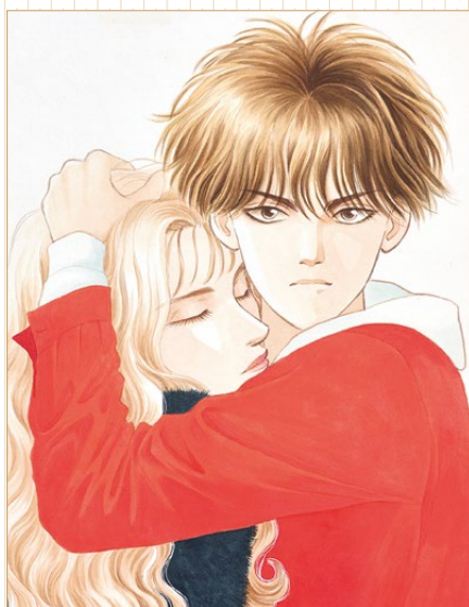
恋のめい 愛の傷「コーラス」1995年2月増刊 表紙