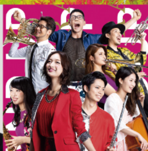
STAND UP! ORCHESTRA