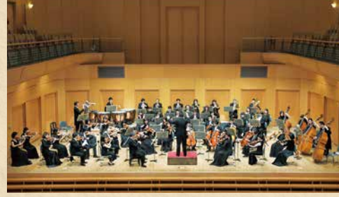
管弦楽 セントラル愛知交響楽団