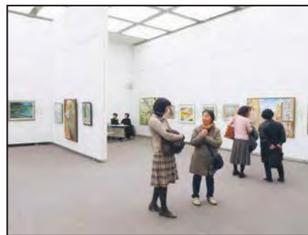
文化フォーラム春日井・ギャラリー

@文化フォーラム春日井・ギャラリー 2021年3月23日(火)~3月28日(日) 10:00-17:00(最終日は16:00まで)