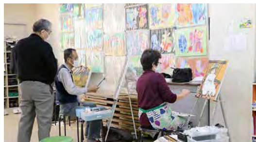
描くときは真剣に! 休憩時間はみんな楽しく! がモットーです。

「絵は、一生懸命描く姿がそのまま表れる、自分の写し鏡みたいなもの。十人十色だし、そこがいいよね」 3月の総合展は、生徒たちの作品が文化フォーラム春日井に並びます。「あれだ