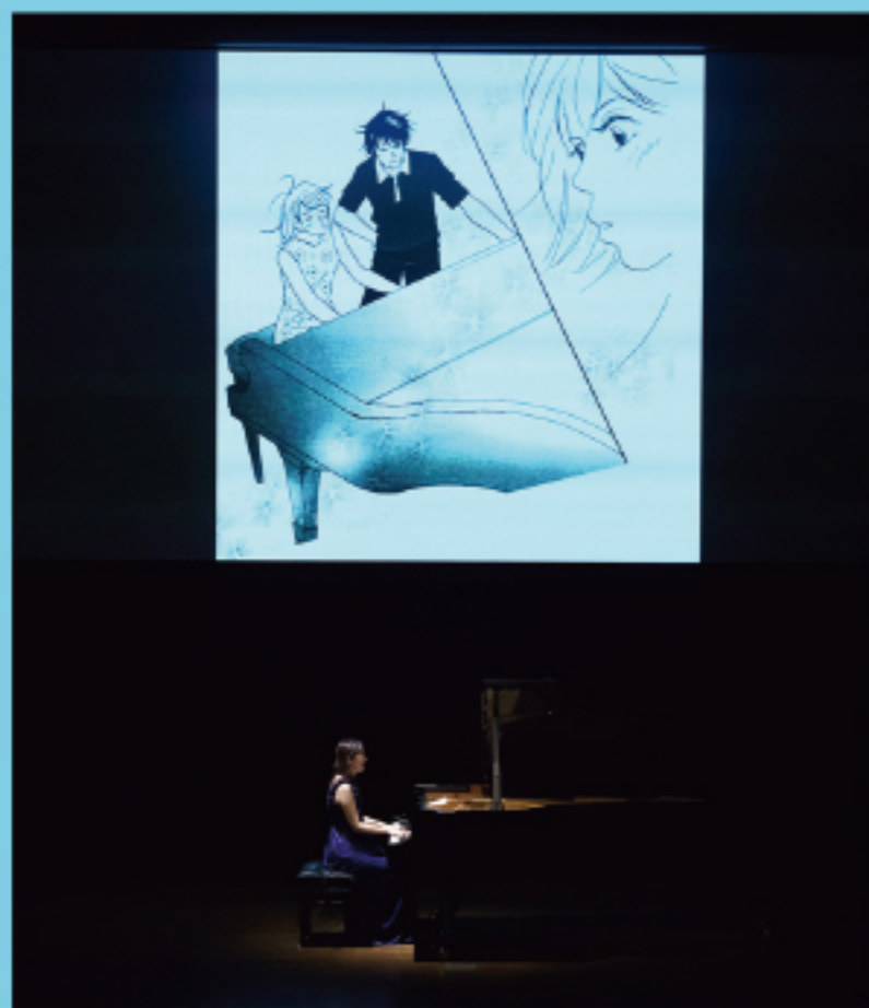
2018.8.17 上田公演@サントミュージゼ 小ホール