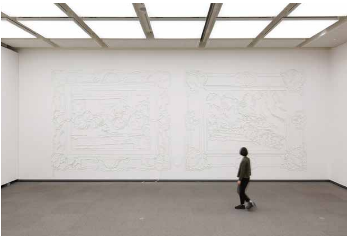
④ 「Window (drawing4,5)」

林 そう、みんなに見てもらえる環境が大切なんですよ。作品を仕上げるとき大きな目標にもなるし、みんな絵を褒め合える。人の意見や感想を聞くというコミュニケーションも生まれ、互いを認め合う場にもなる。 本山 作っている時は一人ぼっちで孤独だから、観覧会にエネルギーの発散先を求めちゃうんです(笑)。あと、学校の掲示板じゃなくて、ちゃんとした白い壁にワイヤーを使って絵を掛けるという体験も良かった。ギャラリー作ったたりもね。世界が広がるんですよ。