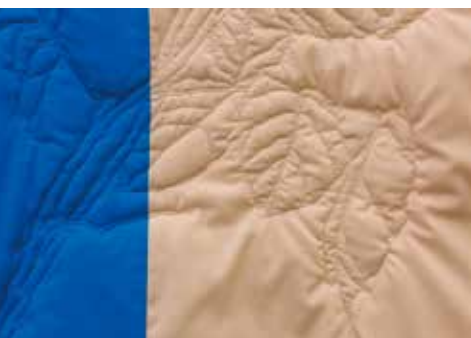
「Ghost in the Cloth (薔薇)」作品部分

2021年4月23日(金)～5月11日(火) 会場：文化フォーラム春日井・ギャラリー