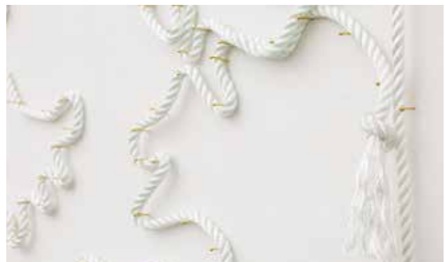
⑥ 「Window (drawing4,5)」作品部分

林 そう、みんなに見てもらえる環境が大切なんですよ。作品を仕上げるとき大きな目標にもなるし、みんな絵を褒め合える。人の意見や感想を聞くというコミュニケーションも生まれ、互いを認め合う場にもなる。 本山 作っている時は一人ぼっちで孤独だから、観覧会にエネルギーの発散先を求めちゃうんです(笑)。あと、学校の掲示板じゃなくて、ちゃんとした白い壁にワイヤーを使って絵を掛けるという体験も良かった。ギャラリー作ったたりもね。世界が広がるんですよ。