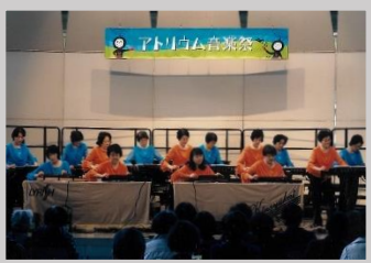
琴修会 春日井支部 玉川教室