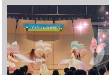
Oriental × Face