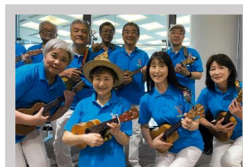
ウクレレユニット・レインボーガーデン