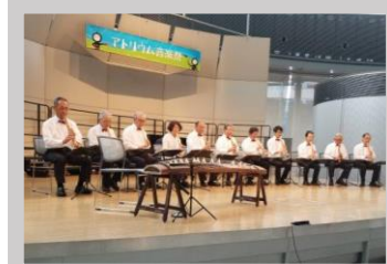
琴古流尺八長月会