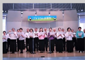
公益社団法人関西吟詩文化協会公認 鷺伸吟詠会東尾張支部