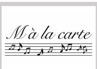
M à la carte