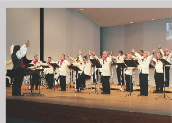
春日井男声合唱団