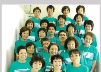
オカリナ・スプリングウェル