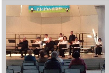
現代邦楽会・春日井