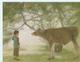
「アキダミの樹の下」

愛知県生まれ。1996年愛知県立芸術大学大学院美術研究科日本画専攻修了。1996年第51回春の院展初入選後、日本画家として活躍。1996年から2020年まで、愛知県立芸術大学模写室にて、東寺 両界曼荼羅園などの模写に参加。主な展覧会歴に、若鶏会日本画展(日本橋三越、名古屋三越/2013～)などがある。現在、日本美術院院友。