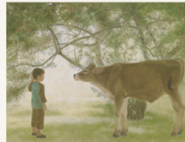
「アキグミの樹の下」

愛知県生まれ。1996年愛知県立芸術大学大学院美術研究科日本画専攻修了。1996年第51回春の院展初入選後、日本画家として活躍。1996年から2020年まで、愛知県立芸術大学模写室にて、東寺 両界曼荼羅圖などの模写に参加。主な展覧会歴に、若鶏会日本画展(日本橋三越、名古屋三越/2013～)などがある。現在、日本美術院院友。