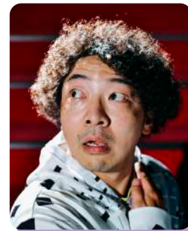
有門正太郎 Shotaro Arikado [俳優、演出家、劇作家]