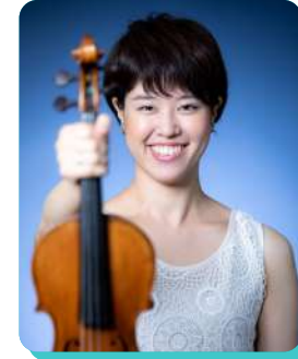
瀬木理央* Rio Segi [ヴァイオリニスト]