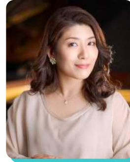
原田綾子* Ayako Harada [ピアニスト]