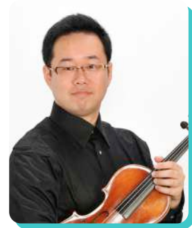
平光真弥 Shinya Hiramitsu [ヴァイオリニスト]