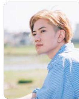
鈴掛真* Shin Suzukake [歌人]