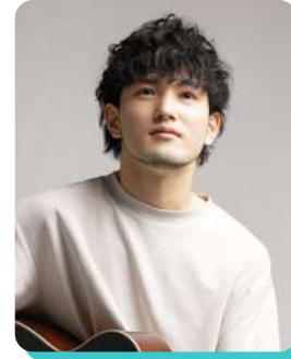
井草聖二 Seiji Igusa [ギタリスト]