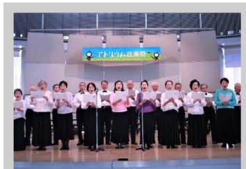
公益社団法人 関西吟詩文化協会 公認 鷺伸吟詠会 東尾張支部