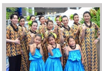
スタジオ・アジラ