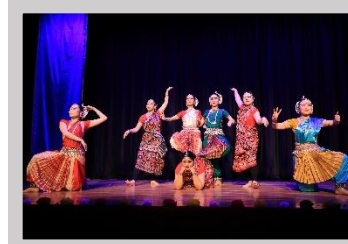
インド舞踊トリダール