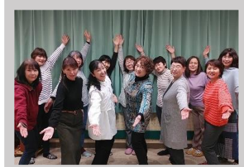
アンサンブル ルーチェム