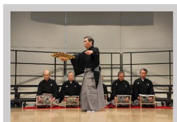
春日井市 能楽連盟