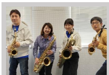
風の四重奏 エオリカ