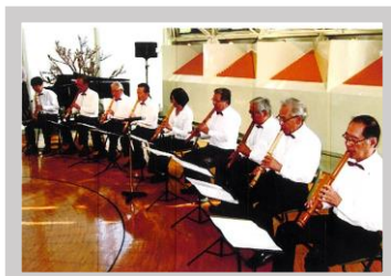
琴古流尺八長月会