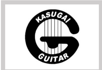
春日井ギターオーケストラ