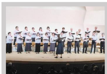
高蔵寺混声合唱団