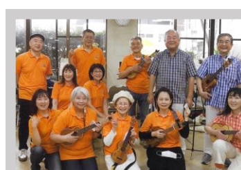
ウクレレユニット・レインボーガーデン