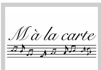
M à la carte