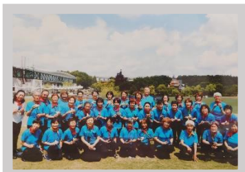
ライリッシュ春日井オカリナクラブ