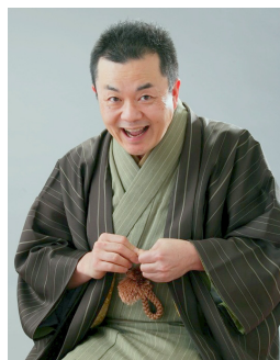
* なるみ家笑天 Narumiya Shouten 社会人落語「落語の会」

掲載アーティストの他にも 春日井にゆかりのある方を中心に 派遣先とご相談の上、 派遣アーティストを決定します。