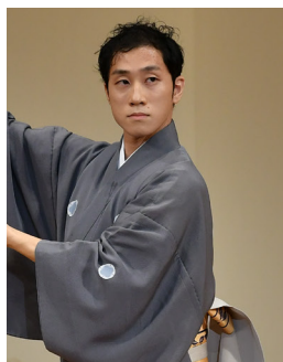
* 藤間勘之介 Fujima Kannosuke 日本舞踊 藤楊會