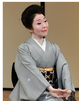
* 藤間勘楊 Fujima Kan'yoh 日本舞踊 藤楊會