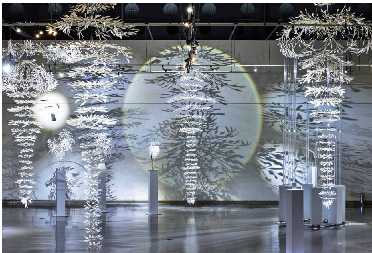
Light and Shadow