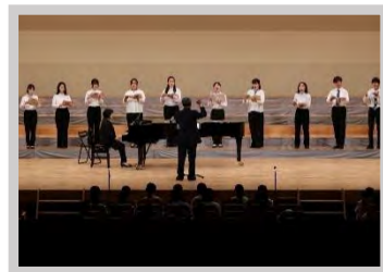
中部大学 混声合唱団