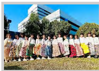
アンサンブル・ルーチェム