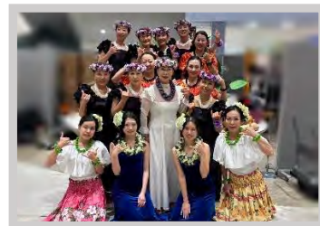
レアレアマカマカ