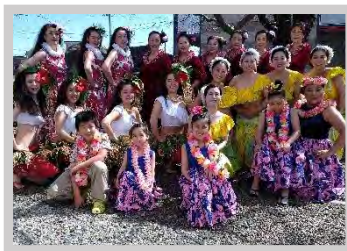
ハーウ・ワ・カウルア・ハアリマオヒ