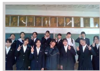
西部中合唱クラブ