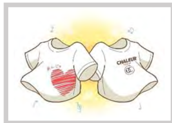
あんじゅ&シャルールママコーラス