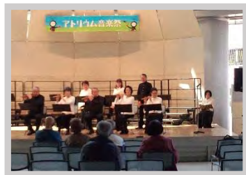
現代邦楽会・春日井