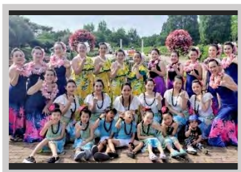
Kahawainani Hula Halau