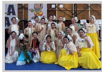
Hui' o kamalei kapiiki