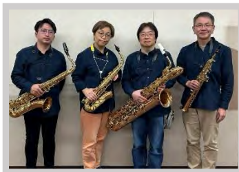
シロクマカルテット