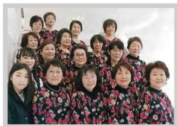
琴修会 春日井支部 玉川教室