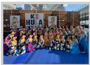
カパフラオブアラニブアメリア