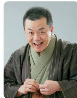
なるみ 家笑天 ＊ Narumiya Shoten 社会人落語「楽語の会」